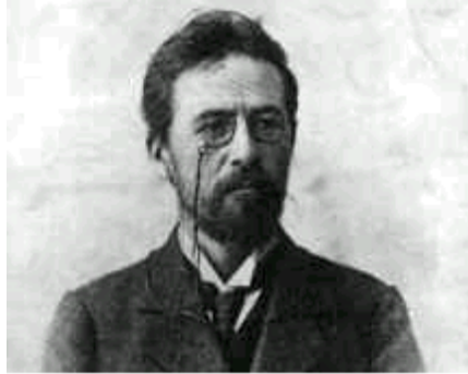
Antón Chéjov (1860-1904)

Dramaturgo y autor de relatos ruso, es una de las figuras más destacadas de la literatura de su época.